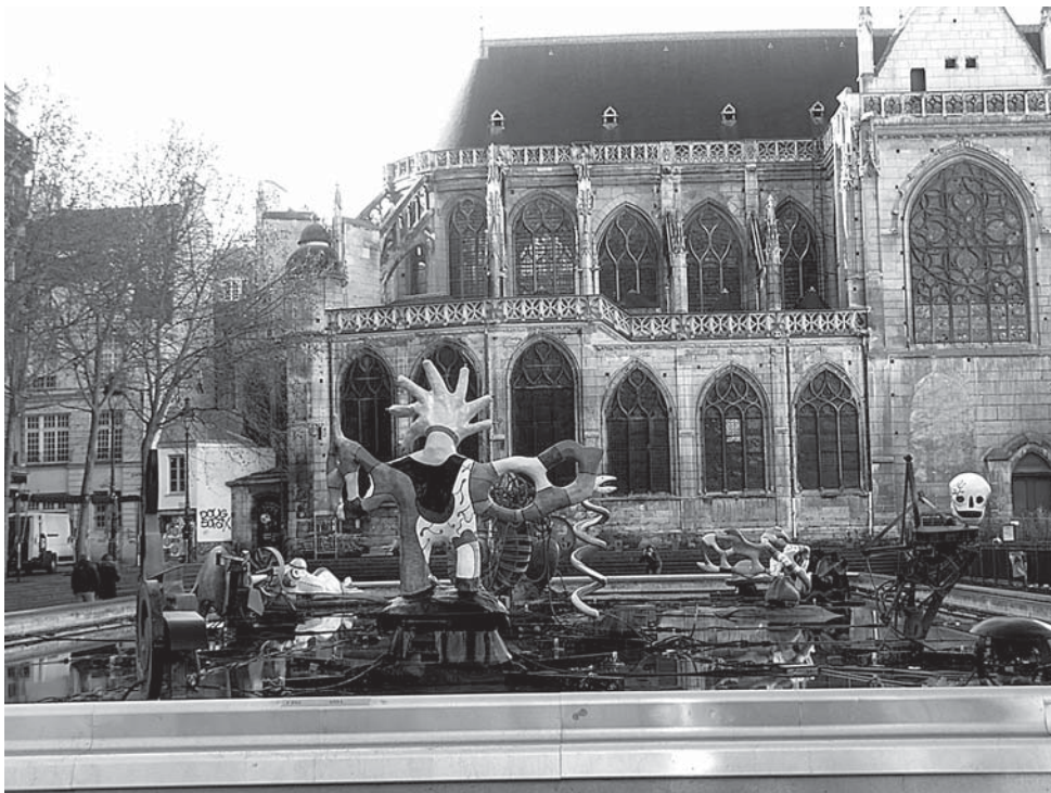
Фото 3. Площадь И. Стравинского, фонтан И. Стравинского

стекло; внутренний модерн с приглушенными серыми цветами и немногими деталями художественного оформления. Как все высокотехнологичные центры из-за потребности держать свои компьютеры непрерывно работающими, IRCAM управляется 24 часа и имеет вид научно-исследовательского института в большей степени, чем центра творчества и музыки (фото 4).