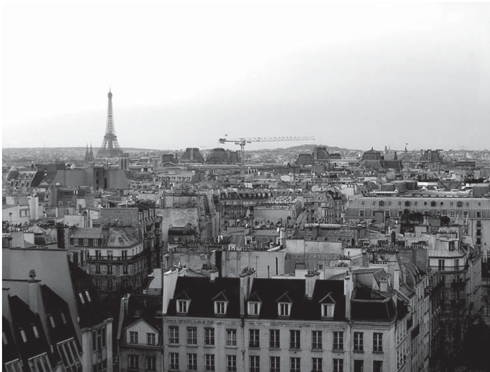
Фото 2. Центр Ж. Помпиду. Смотровая площадка (6 уровень)

IRCAM необычен: главное здание находится на четырех спускающихся уровнях ниже площади Стравинского, смежной с Центром Жоржа Помпиду. Фонтан Стравинского украшен необычными автоматическими скульптурами, поливающими друг друга водой (фото 3). Подземное здание IRCAM было разработано тем же архитектором Роджерсом. Материалы конкретны и функциональны, сталь и