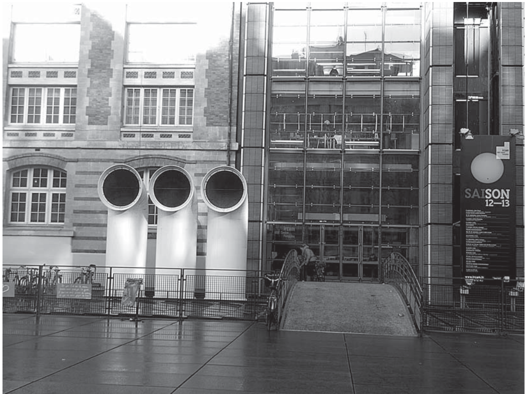
Фото 4. Вход в IRCAM

История IRCAM до 1984 года представляет три разных периода[25]. Первый, с 1970-х до 1977 гг., – планирование здания и развитие стратегии. Второй период, 1977–1980 гг., – открытие IRCAM, создание ансамбля InterContemporain, период целостного спланированного развития. Третья фаза – с 1980 по 1984 гг.