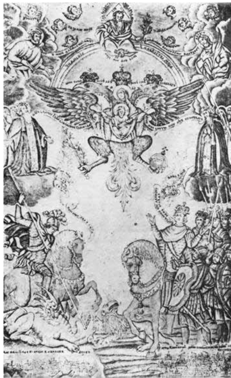
Рис. 2. Фронтиспис Киево-Печерского патерика, 1768 г.

иконография? Почему списки этой иконы существенно отличаются друг от друга? Эти вопросы побудили начать серьёзное исследование, объектом которого и стала икона «Знамение Множества Мира» (Азовская икона Божией Матери), а предметом – история её возникновения, иконография и известные списки.