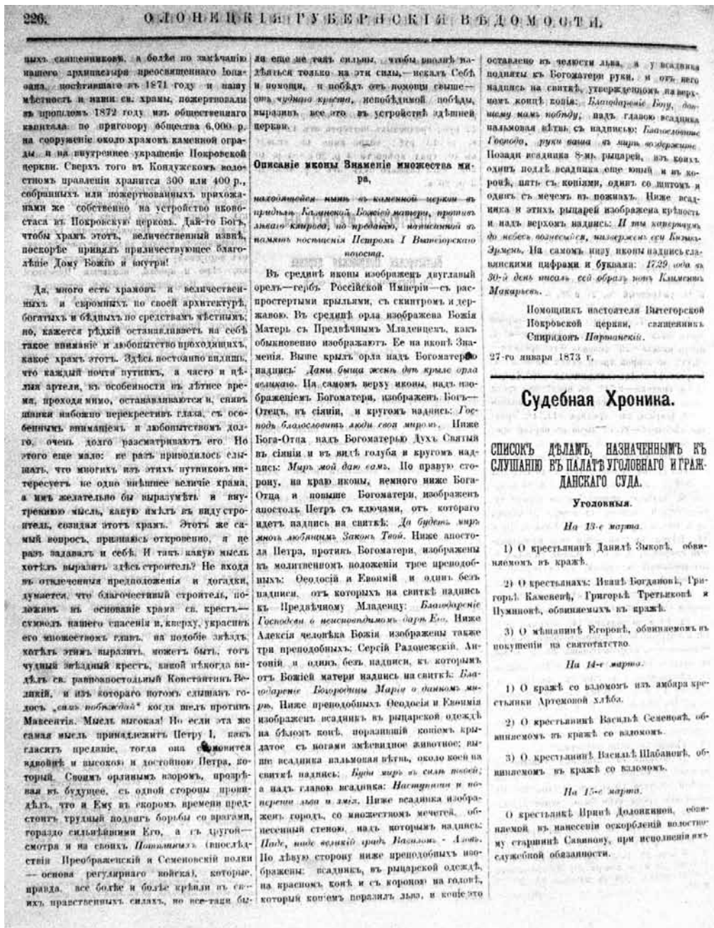
Рис. 5. Страница «Олонецких губернских ведомостей» с описанием иконы «Знамение множества мира» (1873 г.)

лиц, а также почетным мировым судьей» [12] в Олонецкой губернии и был известен как автор «Краткого описания Олонецкой губернии» (Петрозаводск, 1881). В этом очерке подробно приводится описание исследуемой нами иконы. Вот что пишет он о ней: «Вверху изображенъ Господь Саваофъ и вокругъ его слова: «Господь благослови люди своя миромъ» , съ боковъ — «на земль миръ въ челоуцьцхъ благовольнѣ» »<.> Далѣе — спра-