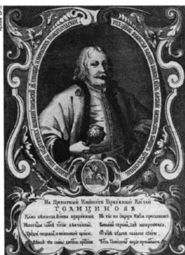
В. В. Голицын. Гравированный портрет работы А. Тарасевича. 1689.