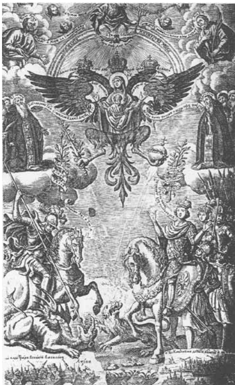
Рис. 1. Фронтиспис Киево-Печерского патерика, 1702 г.