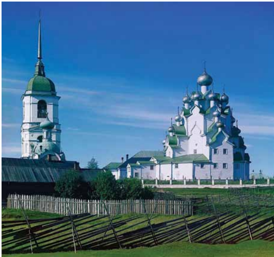
Рис. 3. Покровская церковь в Вытегорском Погосте. Фото 1909 года С.М. Прокудина-Горского