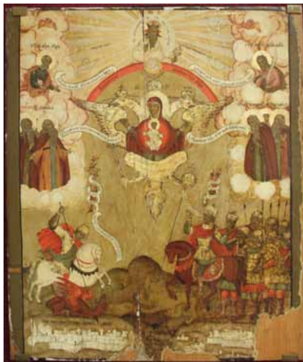
Рис. 4. Икона Божией Матери Азовская «Знамение множества мира». Вытегорский краеведческий музей. Фото 2014 года. Публикуется впервые.

До недавнего времени считалось, что икона «Знамение множества мира» сгорела вместе с Покровским храмом в 1963 году. И только весной 2014 года на сайте Вытегорского музея мы случайно увидели фотографию одного из залов музея, на которой была икона, схожая по описанию с иконой «Знамение множества мира» Азовской. По нашей просьбе директор музея прислала нам фотографию этой иконы (рис. 4) и только тогда стало ясно, что это та самая Азовская икона, ибо изображение в деталях совпало с имеющимися описаниями XVIII века. Икона была перенесена в музей до того, как случился пожар, благодаря чему мы сегодня