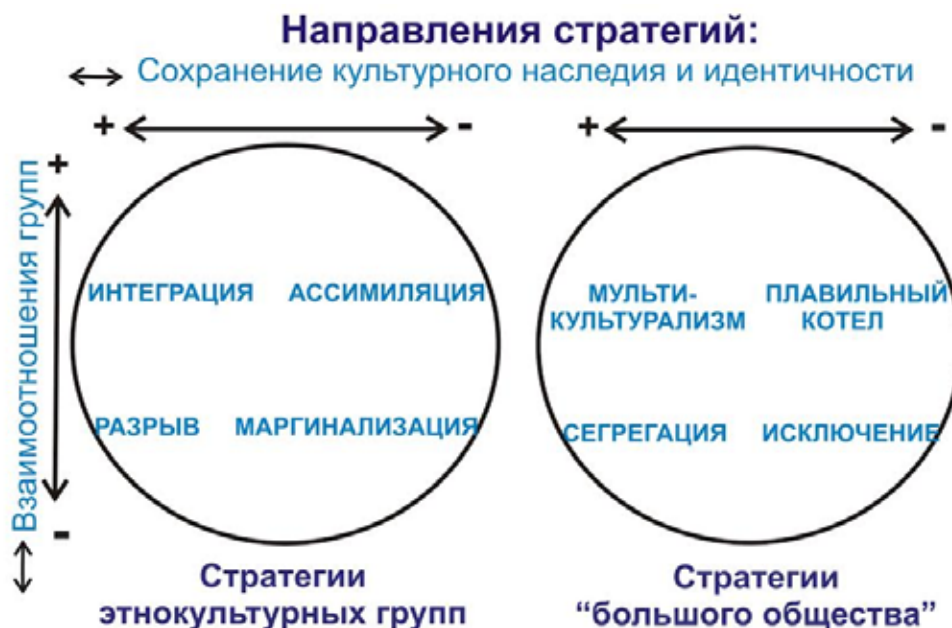
Рис. 4. Многомерная модель развития культурных стратегий общества [21]

вязывать определенные формы аккультурации или ограничивать меньшинство в выборе стратегии. Именно этот аспект упускают из внимания многие исследователи. То есть это взаимный процесс, с помощью которого обе группы приходят к выбору стратегий в конкретном обществе и в определенных условиях. Например, интеграцию можно выбрать и успешно осуществить только когда общество открыто и готово принять в себя культурное разнообразие. Таким образом, чтобы достичь интеграции, необходима взаимная аккомодация. Стратегия интеграции требует от групп меньшинства принять базовые ценности большого общества, но в то же время доминирующая группа должна быть готова адаптировать национальные институты и идти навстречу потребностям всех групп, которые теперь сосуществуют вместе в плюралистичном обществе.