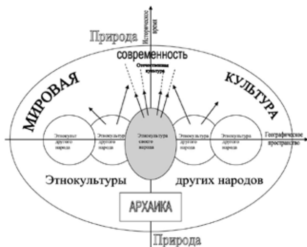
Рис.2. Модель пространства культуры (культурного поля этносов) [1, с. 53]

и проявляются силы, влияющие на индивида [1, с. 52]. Культура представлена как многоуровневая система: культура личности, социальной группы, человечества в целом. Автор указывает на значение этнокультуры в пространстве культуры, которое определяется ее корневой основой, играющей роль фундамента. Под этнокультурой понимается совокупность традиционных ценностей, отношений и поведенческих особенностей, развивающихся в исторической социодинамике и постоянно обогащающих этнической спецификой культуру в различных формах деятельности. Культуры отдельных этносов (традиционные народные этнокультуры) развиваются во взаимодействии, и также разнородные влияния перерабатываются с творческой адаптацией и трансформацией в процессе аккультурации [1, с. 53].