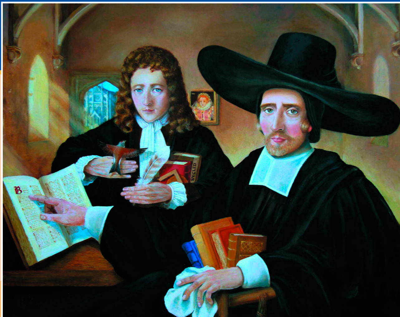
Английский естествоиспытатель и ученый-энциклопедист XVII века Роберт Гук в возрасте семнадцати лет с наставником, директором Вестминстерской школы Ричардом Басби. Худ. Рита Грир.

Портрет школяра. Худ. Ян ван Скорел. 1531 г. ➔ Музей Бойманса – ван Бёнингена, Роттердам, Нидерланды.