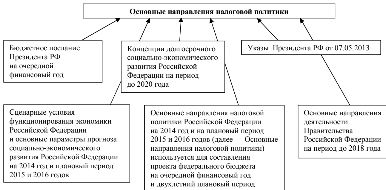
Рис. 2. Основные публикуемые документы налоговой политики.

ности осуществления обратной связи граждан и малых хозяйствующих субъектов с государством по вопросам несовершенствования налогового законодательства