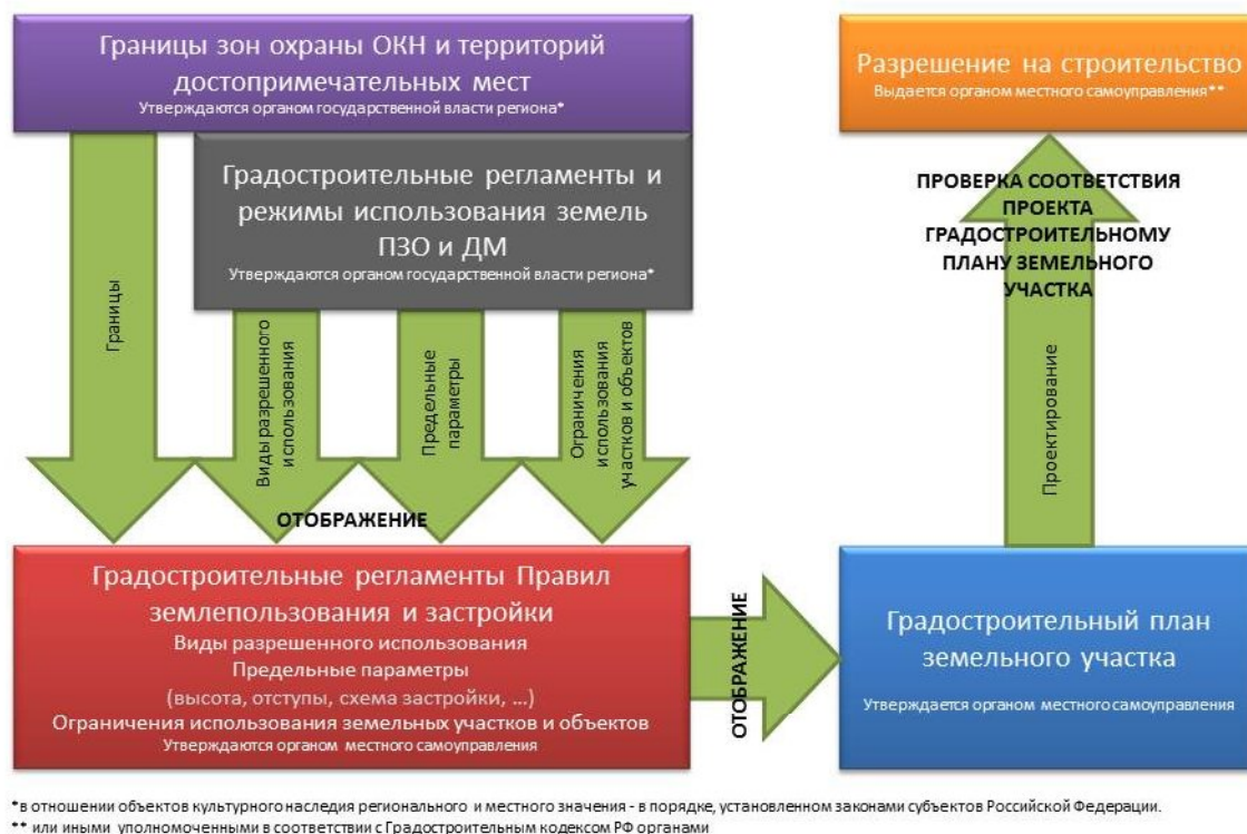
Рис. 3. Применение в регулировании градостроительной деятельности установленных проектами зон охраны и достопримечательных мест ограничений

памятника вдоль улицы, и регламентом зоны регулирования, вводящим ограничения на высоту объемов и пластику фасадов.