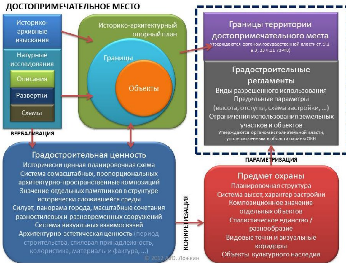
Рис. 2. Принципиальная схема разработки проекта достопримечательного места

Проиллюстрирую конкретным примером. В Перми для памятника архитектуры «Дом жилой А.В. Холмогоровой» в достаточно подробно прописанном предмете охраны лишь две позиции связаны с градостроительным положением памятника: