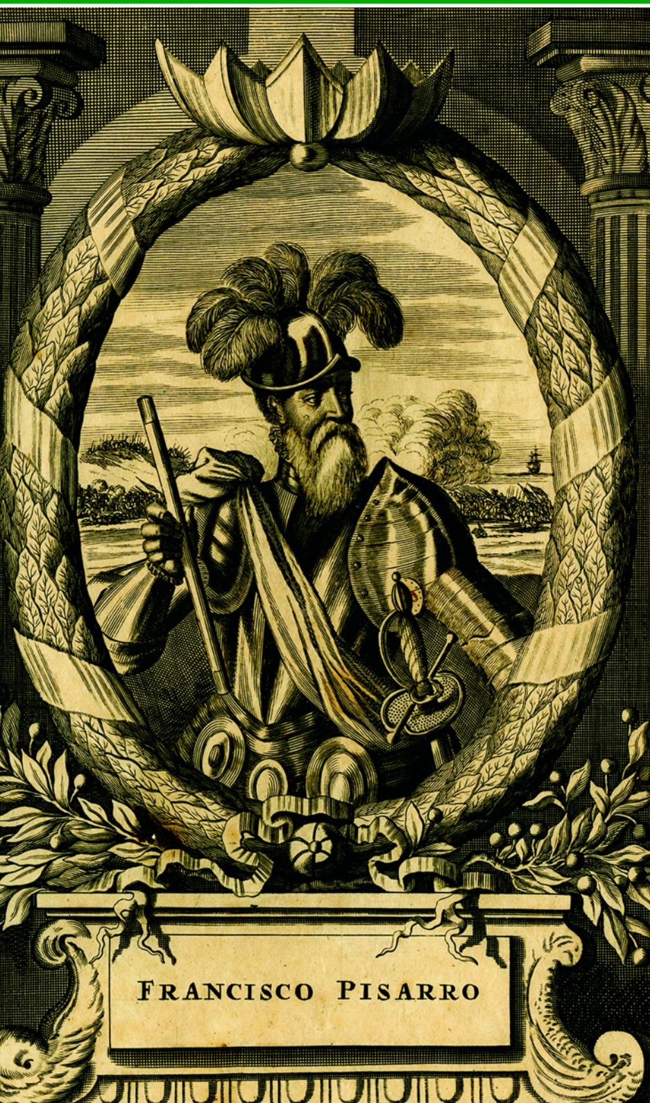
Испанский конкистадор Франсиско Писарро, завоеватель Империи Инков. XIX в. Исторический архив, Гуаякиль, Эквадор.

был заслужить вождь-жрец, бросая сокровища в воду и смывая с себя «золотую кожу».