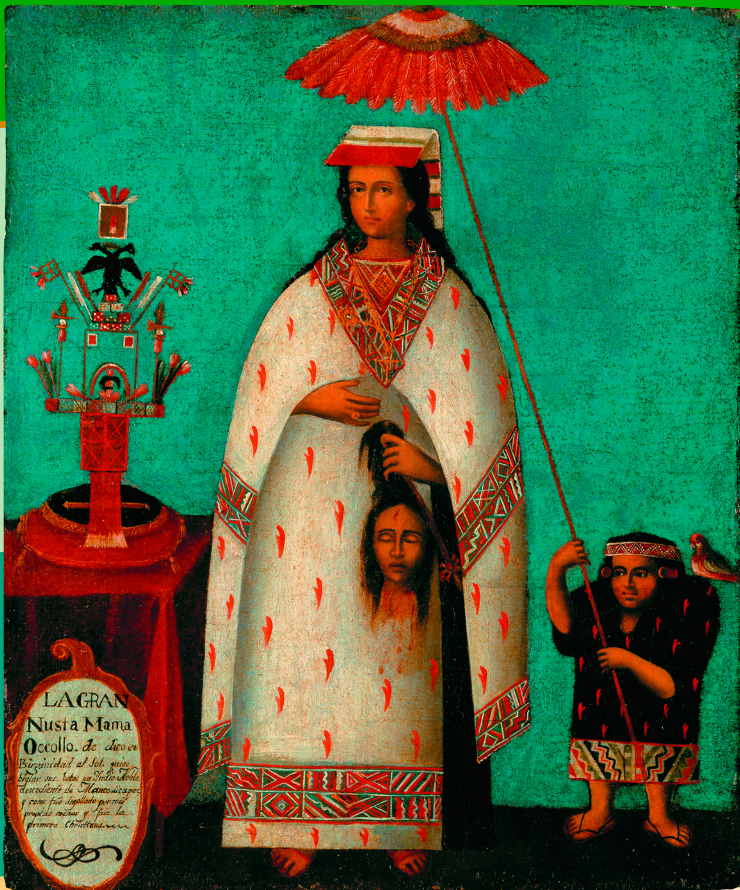
Принцесса Инка. Неизвестный перуанский художник. Около 1800 г. Денверский музей искусств, США.