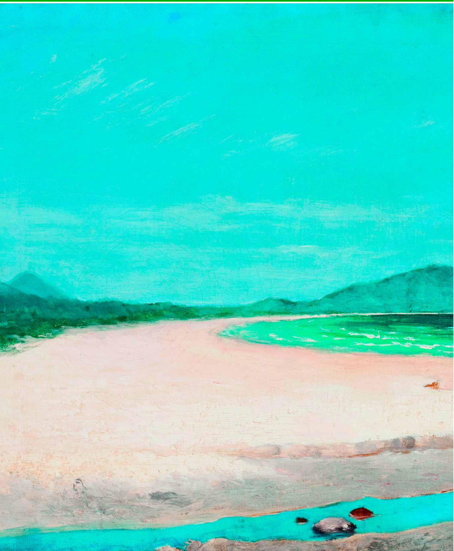
Мыс Гуаружа. Худ. Хосе Феррас де Алмейда Жуниор. 1895 г. Пинакотека штата Сан-Паулу, Бразилия.