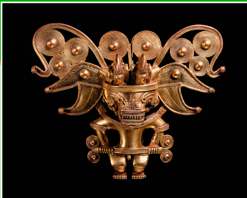
Изображения на странице: Золото инков. Около 1000 г. Из коллекции Музея золота, Лима, Колумбия.

растратил все свои средства на его осушение. Он приказал высечь в скалистом берегу канал и по нему отвести из озера часть воды. Но несколько золотых предметов, которые ему удалось найти, не смогли покрыть ни уже понесенные расходы, ни тем более продолжить дальнейшее осушение озера.