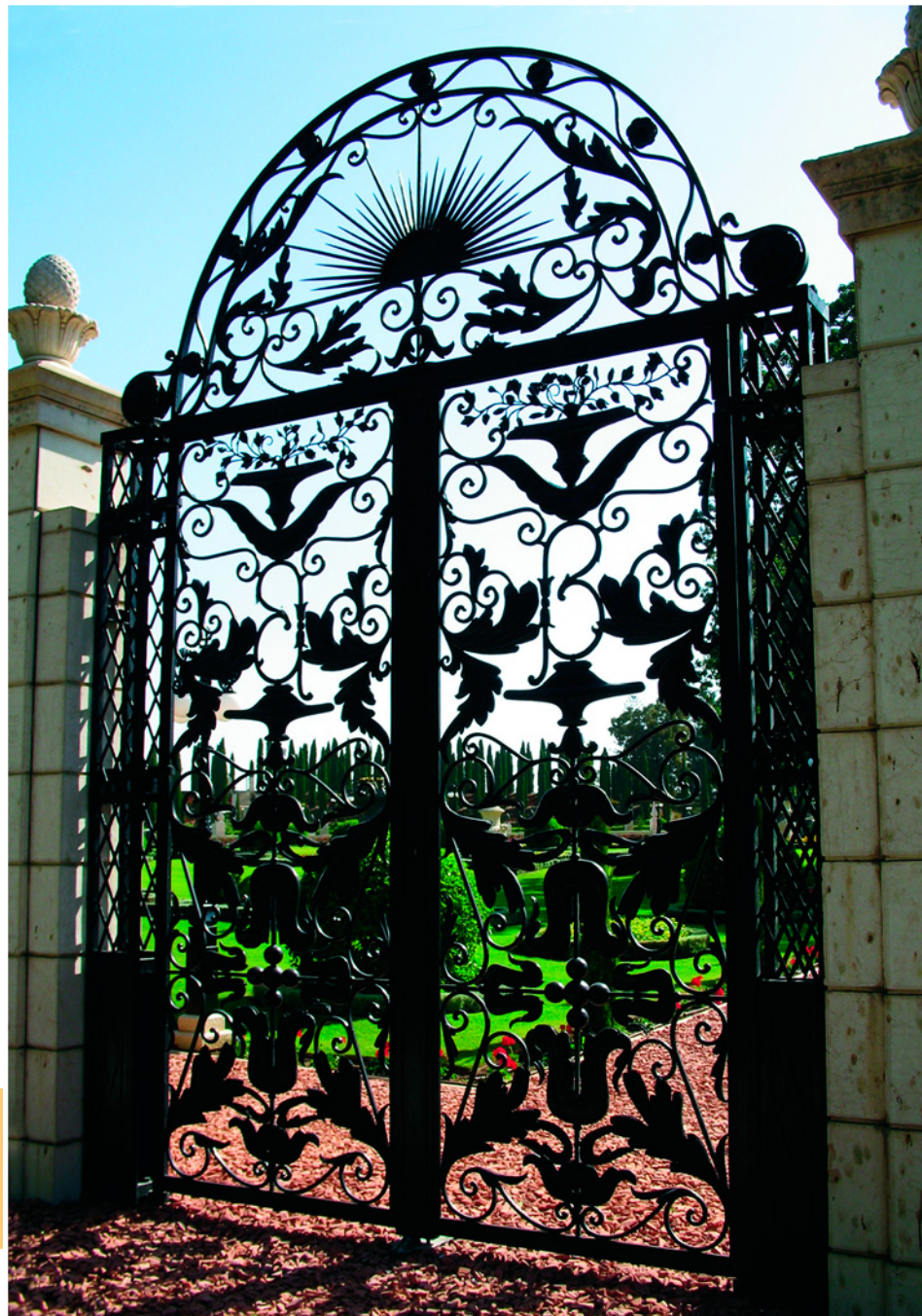
Ворота сада бахаи в Акко, Израиль.

Неподалеку от мавзолея, на склоне горы из белого мрамора, добытого в каменоломнях, из которых