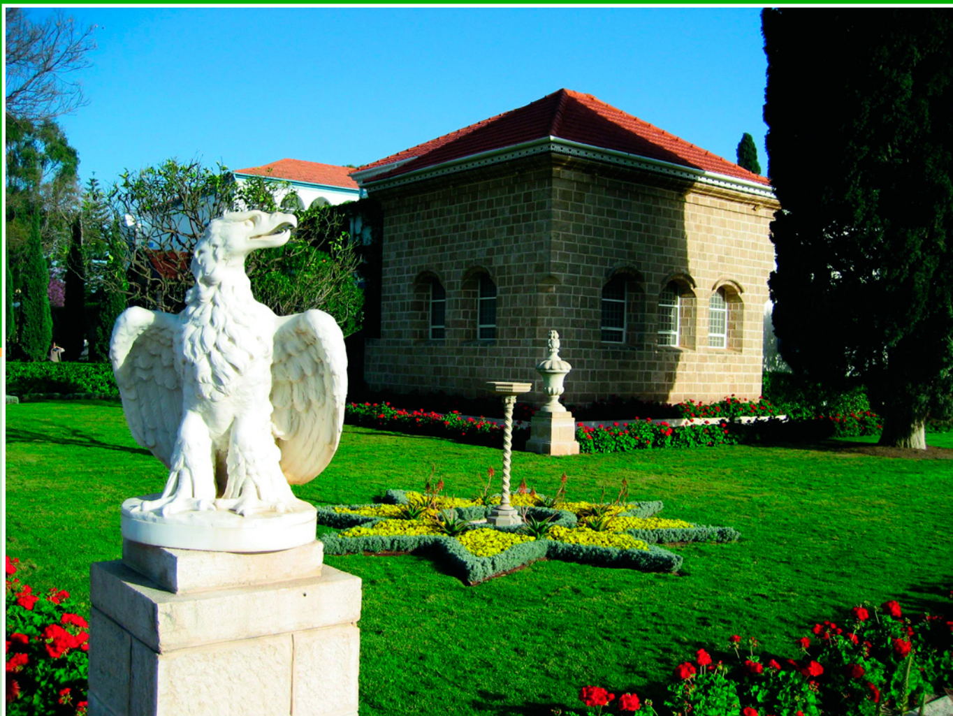
Храм-мавзолей основателя веры бахаи Бахауллы в Акко, Израиль.

вал, писал религиозные сочинения, сформировал своей кружок единомышленников. В 1852 году, будучи достаточно широко известным под новым именем – Бахаулла, что означает «Слава Божья» – Мирза Хусейн Али был арестован. После четырех месяцев пребывания в тюрьме его выслали в Багдад, затем в Стамбул. Долгие годы был узником тюрьмы в израильском городе Акко. Перед выездом из Багдада Бахаулла двенадцать дней – с 21 апреля по 2 мая – жил в загородном саду. Впоследствии этот сад называли Ризван, что буквально означает «довольство», «удовлетворение», а по смысловому значению ближе всего к понятию рая. Так как в этом саду