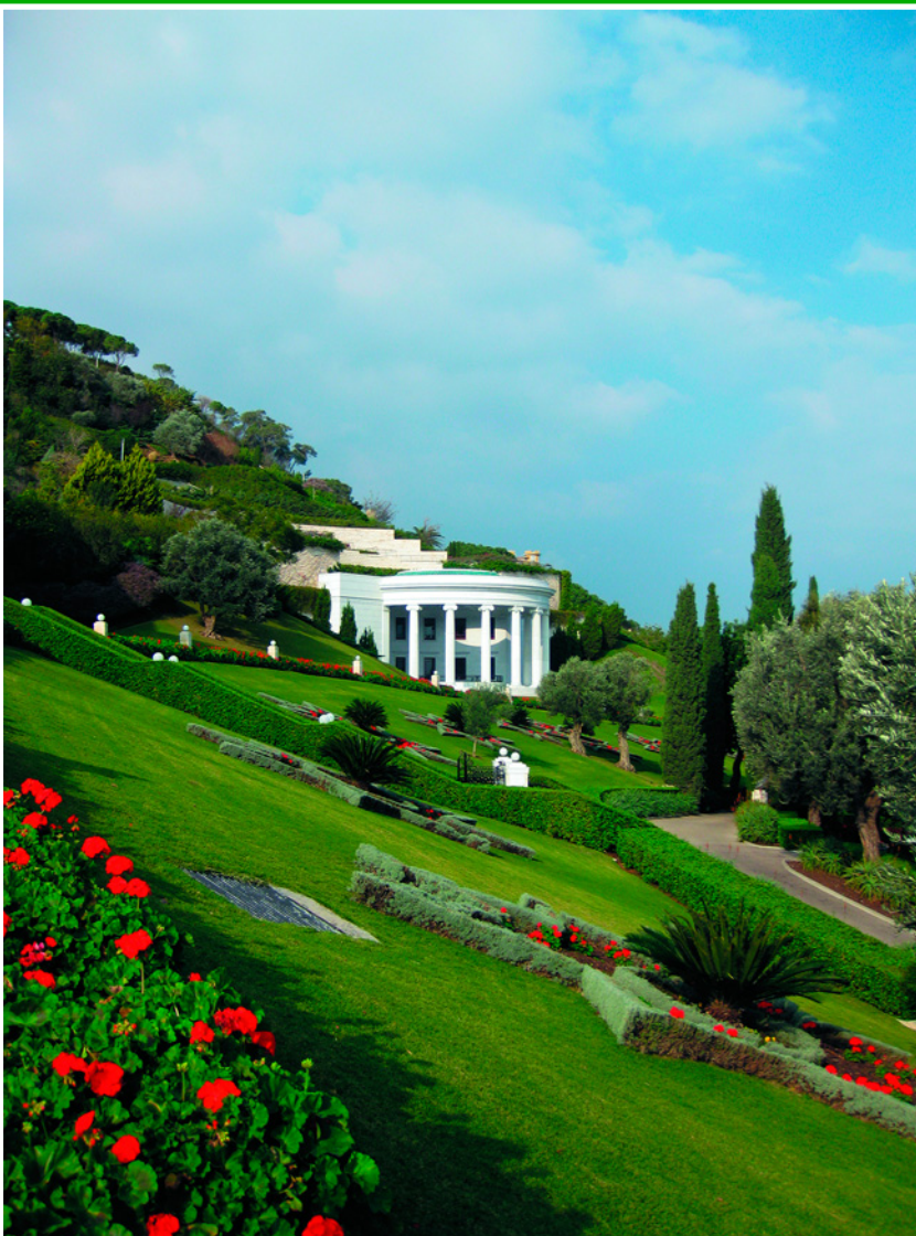
Центр изучения священных текстов во Всемирном административном и духовном центре религии бахаи в Хайфе, Израиль.

не захоронили их на израильской горе Кармель. В начале XX столетия садовники из Персии разбили вокруг мавзолея Баба каскады террас прекрасного сада, который нередко называют «Восьмым чудом света».