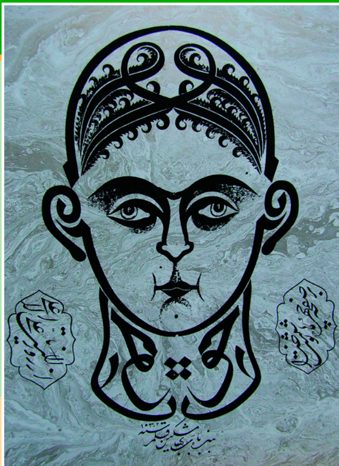
Визуальный символ веры бахаи, известный как Величайшее Имя.

Автором символа является один из 19 апостолов Бахауллы, знаменитый персидский каллиграф Мирза Хусейн-аль-Исфахани, за искусный стиль получивший прозвище Мишкин Калам. Он часто писал фразу «О Ты, Слава Самых Славных!» в различных формах, принимавших нередко изображение птицы или лица человека и отправлял их повсюду.