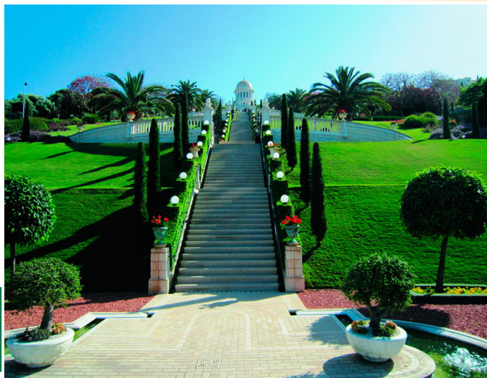
Лестница ведущая к усыпальнице Баба на горе Кармель в Хайфе, Израиль.

Ассоциации с событиями более древних времен вызывает не только описание казни, но и прошедшего страшного урагана и тьмы, опустившейся на землю после расстрела Баба. Но таково предание. Последователи Баба перевозили его останки с места на место более 60 лет, пока