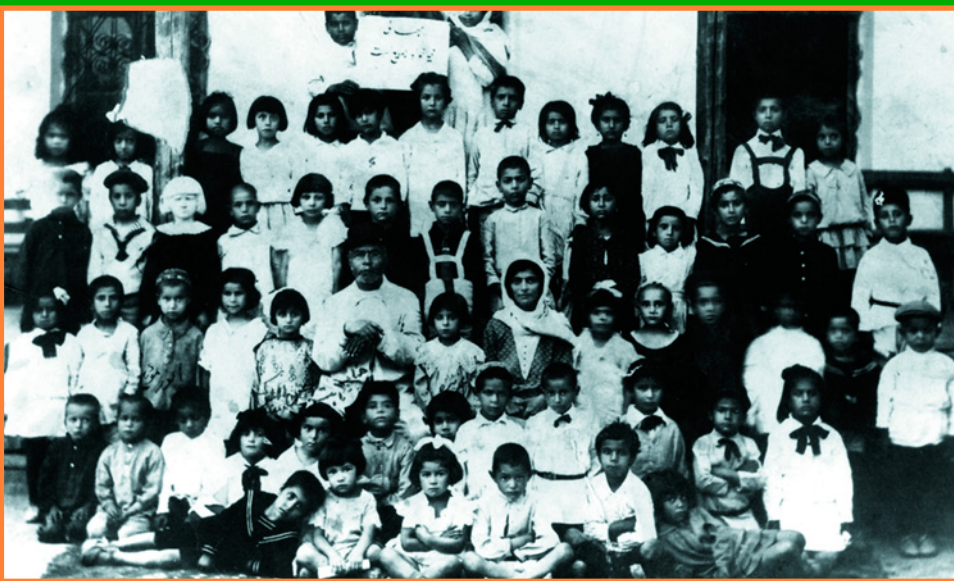
Детский сад общины бахаи, Фотография 1930 г.

брали камень для афинского Парфенона, было возведено здание Всемирного дома справедливости. Террасы выстроены в форме девяти (все то же, священное для бахаи число) концентрических колец, расходящихся от святилища. Сверху донизу, вдоль террас, идет бело-снежная лестница, ведущая к прямой улице, выходящей на море. В целом