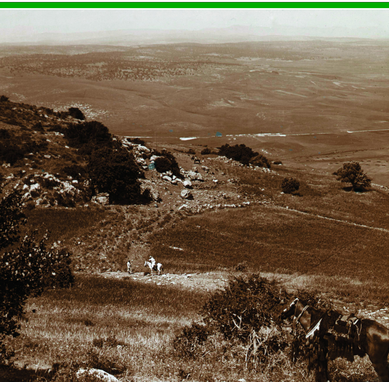
Гора Кармель. Место посрамления жрецов Ваала пророком Ильей. Фотография XIX в.

ников в Баба стреляли 750 армянских солдат. После того как рассеялся дым, все увидели, что учитель цел и невредим, стоит с развязанными руками, а после неожиданно исчез из вида. Изумленная стража вернулась к камере Баба, и с удивлением