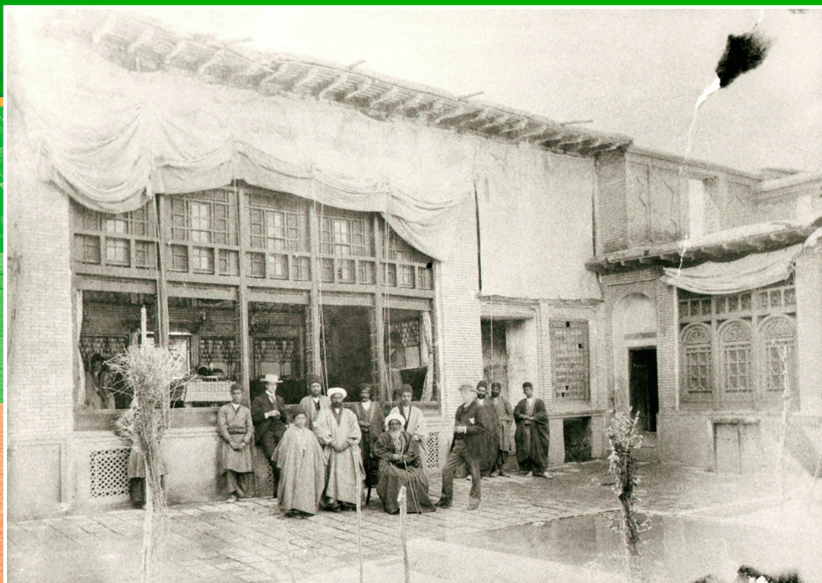
Община бахаи, основанная Афнаном-и-Кабиром из Шираза. Фотография 1891 г.

Святым местом для бахаи является сад в местечке Бахджи около Акко, где почти сорок лет находился в тюрьме, а потом на поселении Бахаулла. Второе по святости место – садово-архитектурный комплекс в Хайфе, где был в свое время обустроен мавзолей Баба.