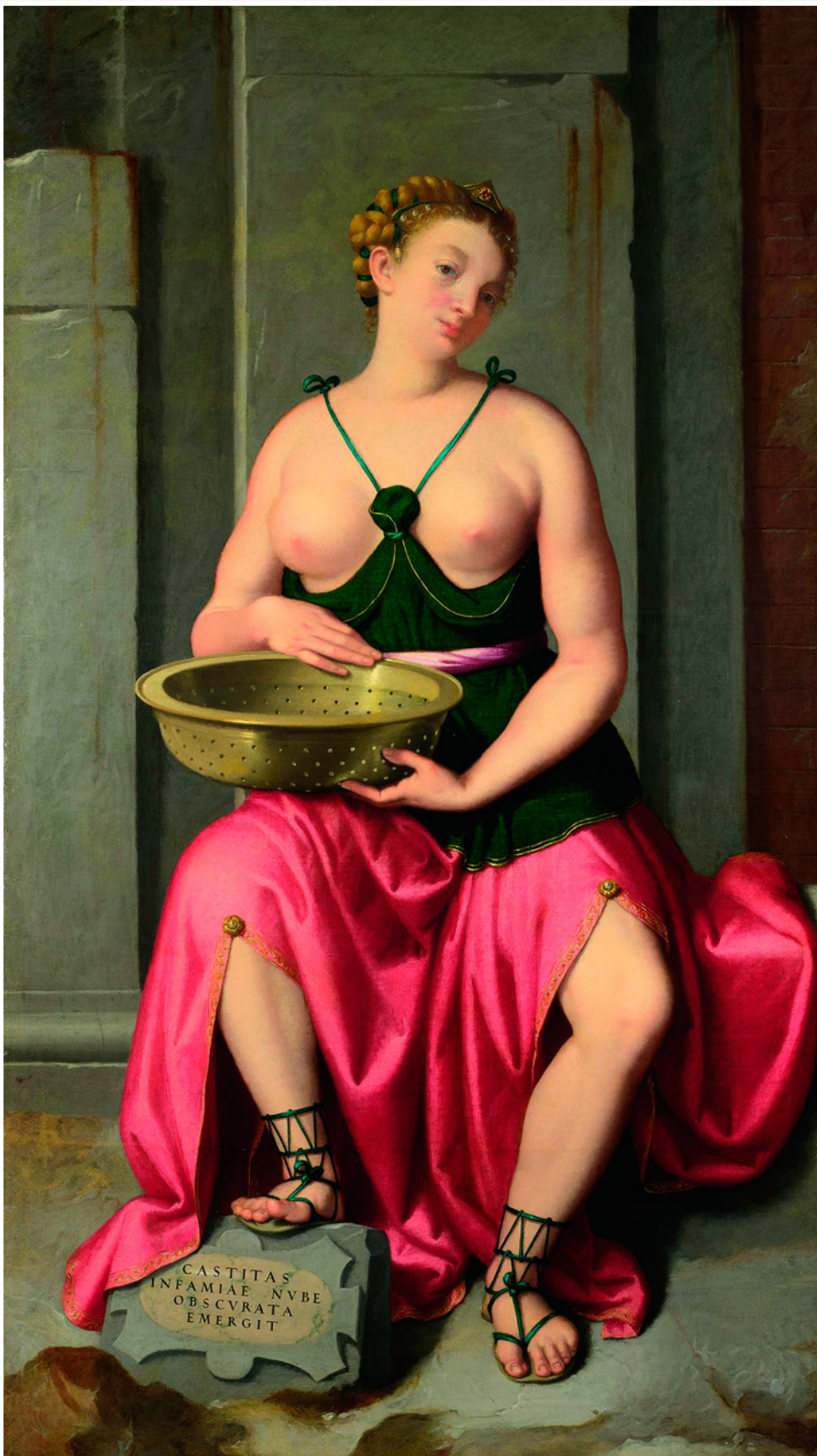
Весталка-девушка Туккиа. Худ. Джованни Баттиста Морони. XVI в. Лондонская Национальная галерея, Лондон, Великобритания.

отныне будет прибавляться почетное прозвище Amata – «Возлюбленная». Но прежде, чем они будут допущены в святилище богини, избранницам предстояло пройти десятилетнее обучение у старшей весталки. Следующие десять лет предназначались служению, и в последние десять лет жрица становилась старшей весталкой. Все вместе это занимало тридцать лет жизни, после чего весталка могла поселиться в городе, выйти замуж и продолжить род. Происходило подобное, однако, крайне редко. Как правило, состарившиеся жрицы оставались жить при храме, где их окружали величайшим почетом, а после смерти хоронили в черте города – честь, которой удостаивались лишь очень немногие и самые значительные римские патриции.