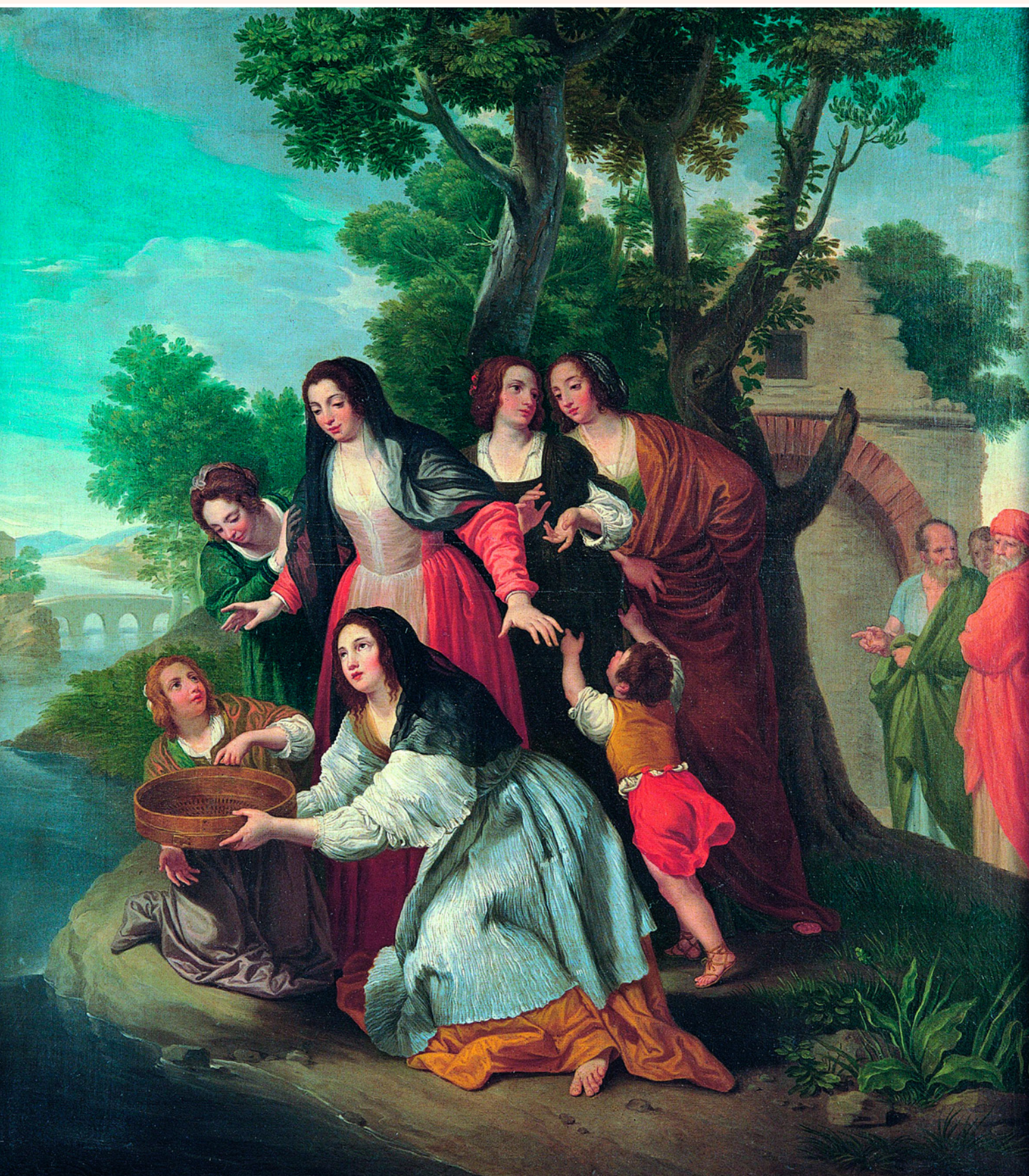
Весталка Туккиа. Худ. Доменико Корви. XVIII в. Капитолийские музеи, Рим, Италия.

Весталку Туккию обвинили в нарушении целомудрия, но она присягнула богам, что чиста, и доказала свою непорочность, принеся решетом воды из Тибра.