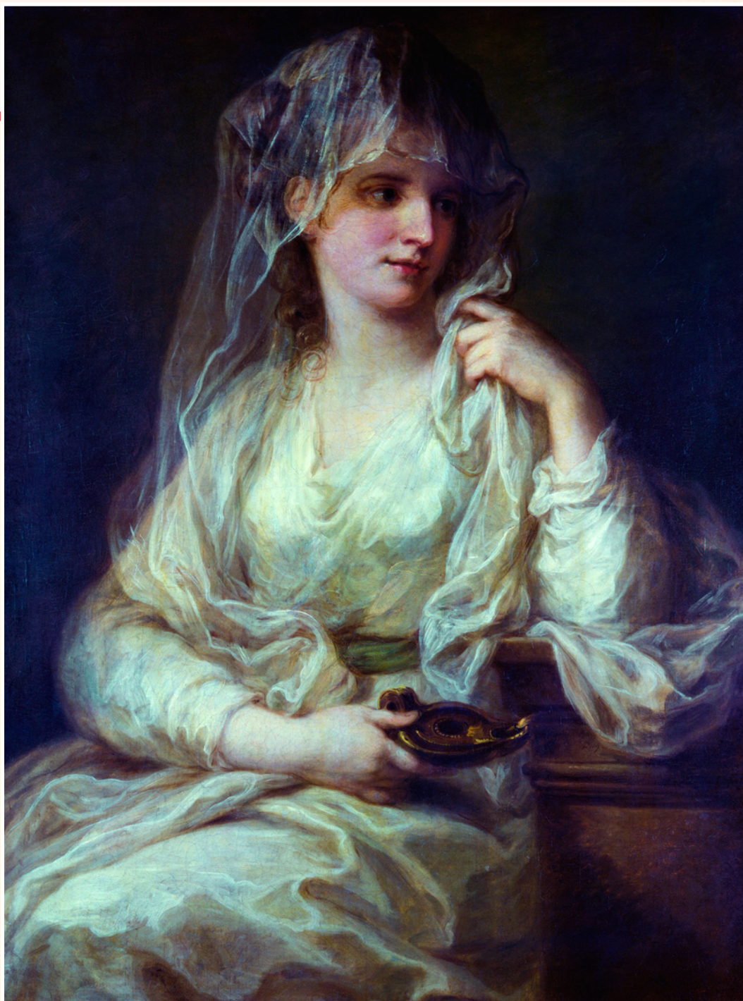
Весталка. Худ. Анжелика Кауфман. XVIII в. Галерея старых мастеров, Дрезден, Германия.

но Амулию, он приказал похоронить ее заживо, а рожденных ею близнецов положить в корзину и бросить в Тибр. Дальнейшая история Ромула и Рема хорошо известна. Корзину прибило к берегу у подножия Палатинского холма, где их вскормила волчица, а воспитанием занимались прилетевшие дятел и чибис. Впоследствии эти три животных стали священными для Рима. Затем близнецов приняли в свою