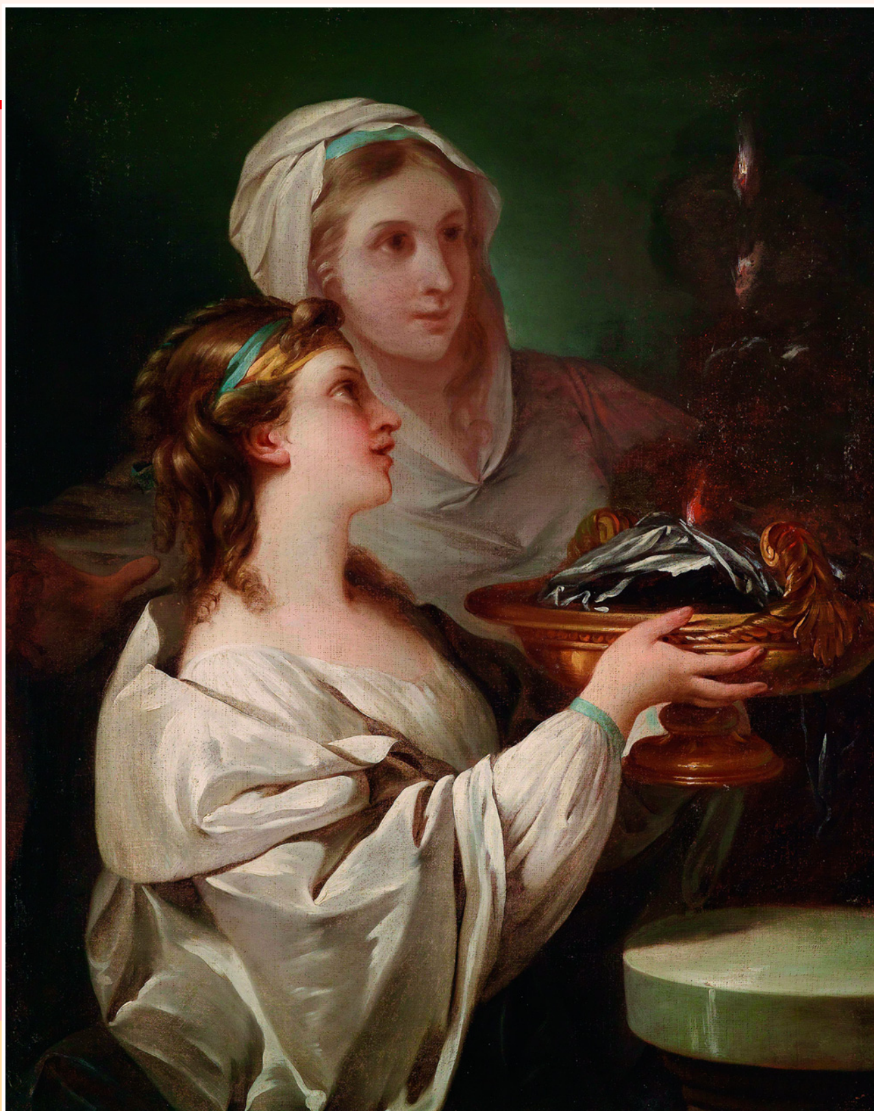
Две весталки. Худ. Иоганн Баптист Лампи Старший. XVIII в. Галерея аукционного дома Dorotheum, Вена, Австрия.

Рима, но и основателем культа богини Весты. Во всяком случае, доподлинно известно, что поклонение ей было одним из древнейших культов Рима, занимавшим первос-