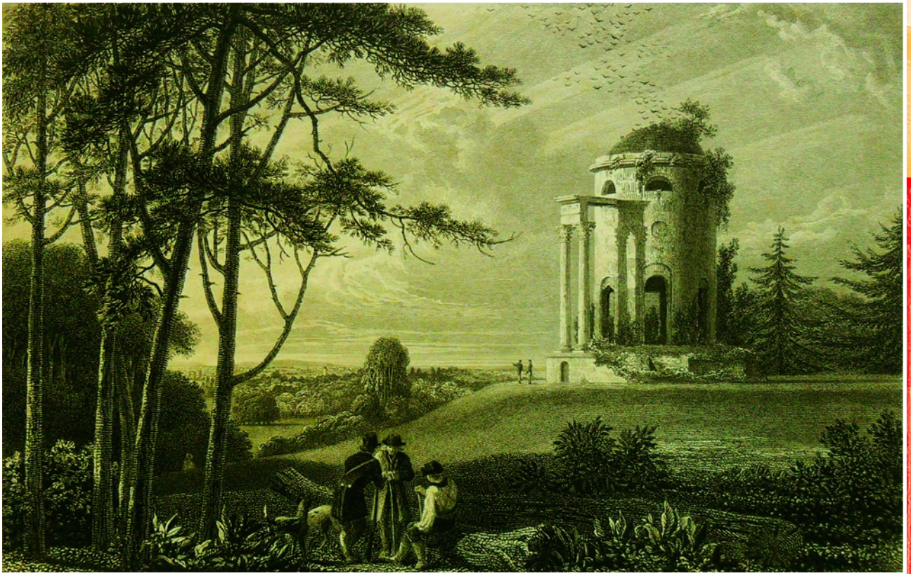
← Весталка, украшающая гирляндой алтарь. Худ. Карл Фридрих Деккер. 1918 г. Галерея аукционного дома Dorotheum, Вена, Австрия.