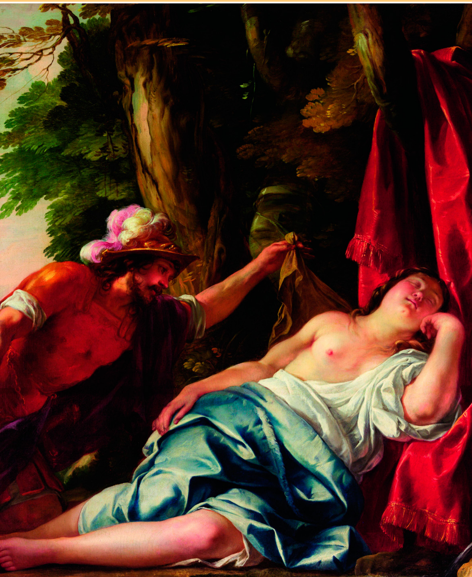
Марс и весталка Рея Сильвия, от любви которых родились близнецы Ромул и Рем. Жак Бланшар. 1638 г. Художественная Галерея Нового Южного Уэльса, Сидней, Австралия.