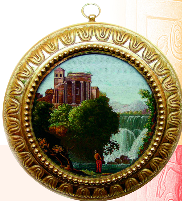
Храм Весты в Тиволи. 1810 г. Из церкви кармелитского монастыря. Санта-Мария дель Кармине. Милан, Италия.

В Древнем Риме хранительница огня была любима едва ли не больше, чем ее божественная «соседка» Венера. Кстати, и римская Веста, и греческая Гестия к делам