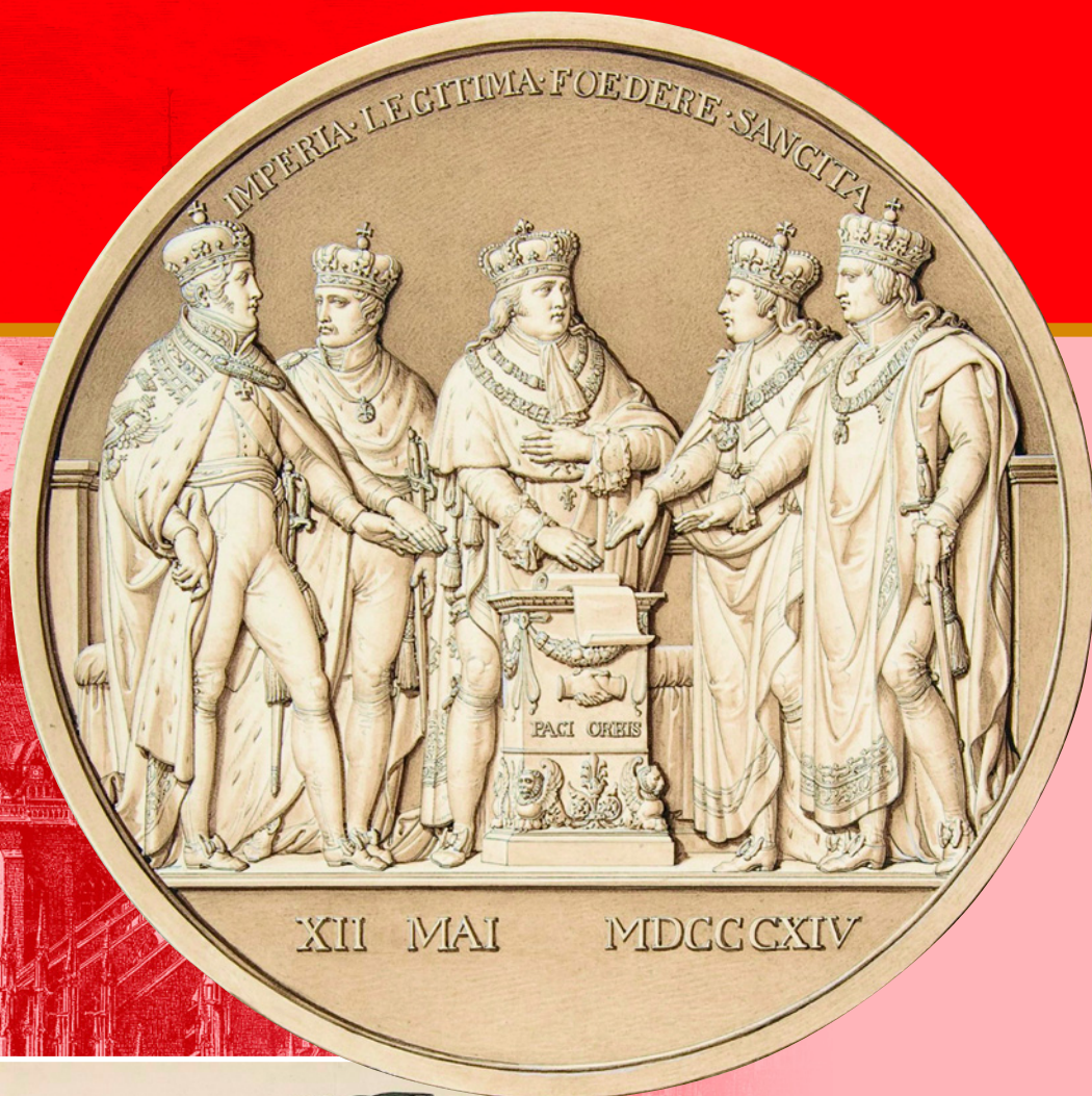
Монархи Европы. Медаль в честь Парижского мирного договора 1814 г., предварявшего конгресс в Вене. XIX в. Музей Метрополитен, Нью-Йорк, США.