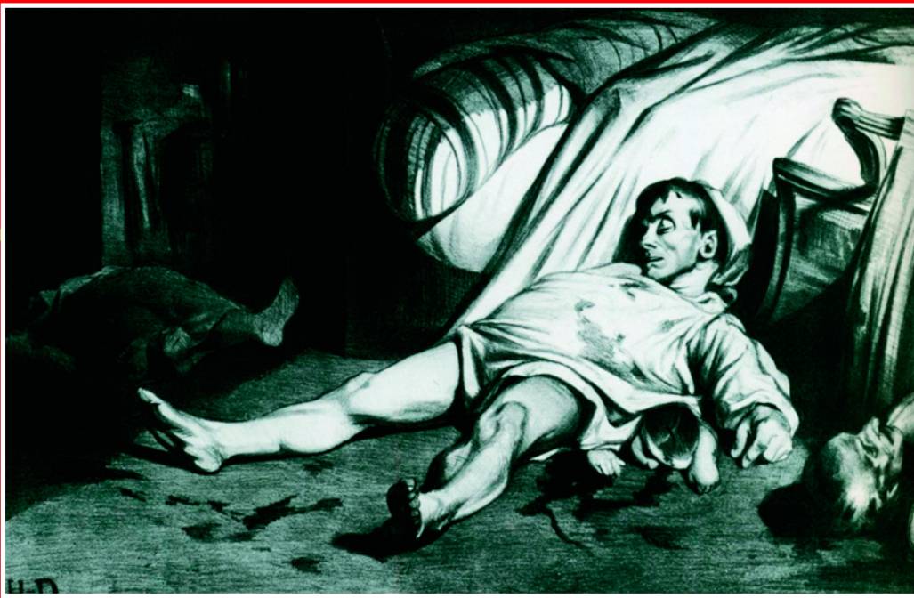
Улица Транснонен 15 апреля 1834 года. Литография Оноре Домье. Британский музей, Лондон. Великобритания.

Литография «Улица Транснонен» изображает трагический финал рабочих восстаний в 1834 г., когда солдаты королевской армии ворвались в один из домов и перебили всех жильцов, включая женщин и детей. Правительство запретило ее издание, пачки нераспроданных литографий были конфискованы и сожжены.