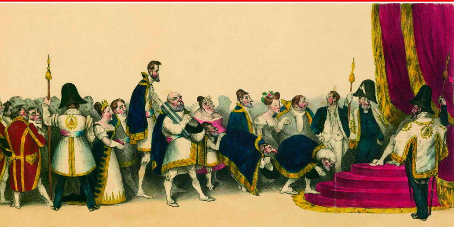
Просители королевского двора. Литография Оноре Домье. 1832 г. Частное собрание.

Французская дипломатия оказалась перед дилеммой: она могла либо принять участие в коллективном урегулировании кризиса наряду с другими великими державами, либо оказать поддержку Мухаммеду Али, поставив себя в оппозицию всей Европе.