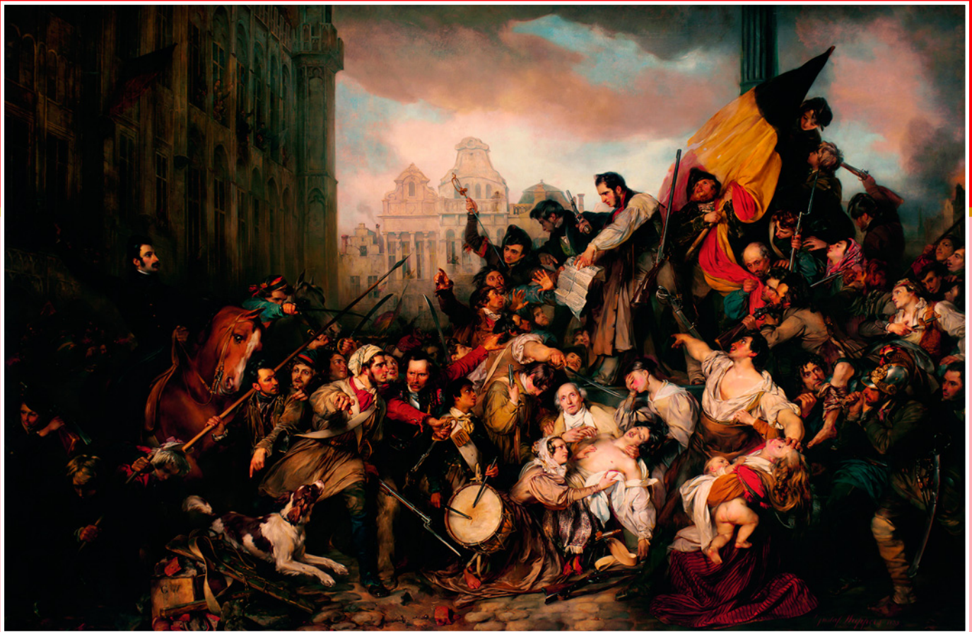
Эпизод сентябрьских дней. Бельгийская революция 1830 года. Худ. Густав Вапперс, 1835 г. Королевские музеи изящных искусств, Брюссель, Бельгия.

Главной внешнеполитической задачей нового французского короля стало получение признания от великих держав, поэтому он занимал в европейских делах весьма умеренную позицию и прилагал все усилия для того, чтобы выглядеть в глазах Европы не «королем баррикад», а более или менее респектабельным правителем.