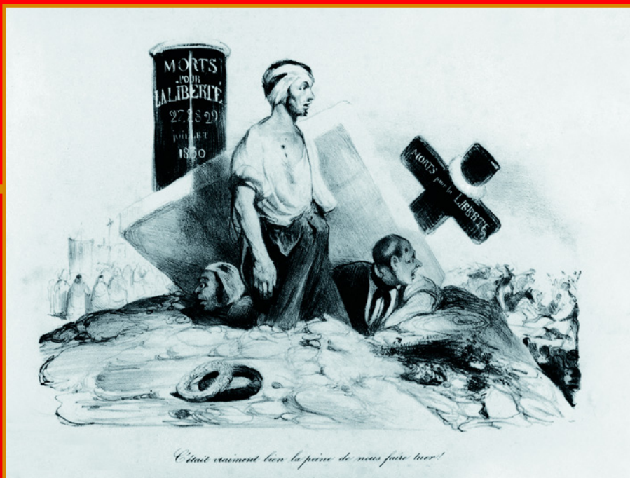
Похороны свободы. Литография Оноре Домье. 1830-е гг. Женевский музей искусства и истории, Женева, Швейцария.

сначала попробовал добиться того, чтобы Франция разрешили присоединиться к этому соглашению, но, получив отказ, стал энергично готовиться к войне. Планы Тьера в очередной раз не нашли поддержки у Луи-Филиппа. В начале октября 1840 года Тьер подал в отставку, но был вынужден забрать прошение назад, хотя было очевидно, что воинственный министр и пацифистки настроенный король не смогут ужиться вместе. Окончательный разрыв наступил после того как Луи-Филипп отклонил составленный Тьером проект тронной речи, которая имела весьма жесткий характер.