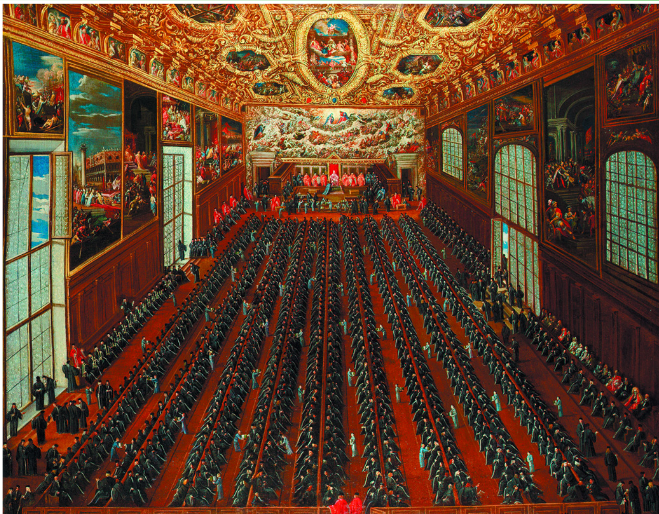
Заседание Большого Совета Венеции во Дворце дожей. Худ. Джозеф Хайнц Старший. 1678 г. Галерея аукционного дома «Christie's», Лондон.