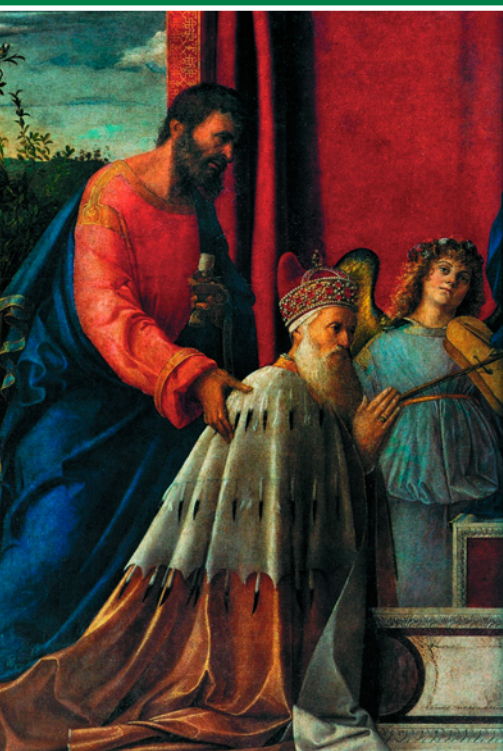
Св. Марк представляет Агостино Барбариго, 74-го венецианского дожа. Деталь картины «Мадонна с младенцем, св. Марком, св. Августином и коленопреклоненным Агостино Барбариго». Худ. Джованни Беллини. 1488 г. Церковь Сан-Пьетро-Мартире в Мурано, Венеция, Италия.

разрушения. Начиная с XII века этот обряд проводился ежегодно, и, обычно, был приурочен к Празднику Вознесения.