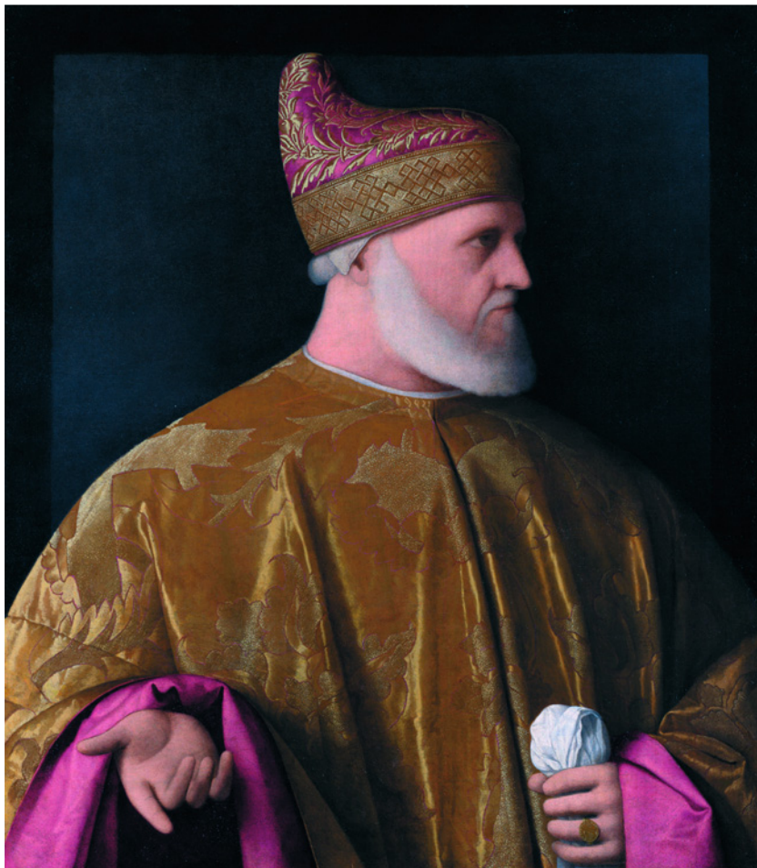
Портрет 77-го венецианского дожа Андреа Гритти. Худ. Винченцо Катена. Между 1523-1531 г. Лондонская Национальная галерея, Лондон.

даемая торжественной процессией из гондол, двигалась к острову Лидо, одному из островов венецианской лагуны, считавшемуся вратами Адриатики. Здесь дож со словами « Desponsamus te, mare » – «Мы женимся на Вас, Море», бросал в воду освященный церковью золотой перстень. Согласно легенде, один рыбак получил этот перстень от святого Марка в ту ночь, когда сатана собирался наслать на город бурю, и именно он спас Венецию от