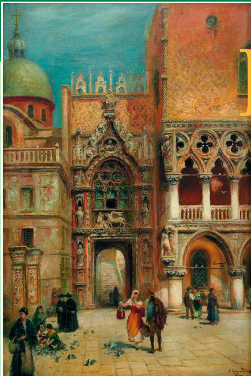
Венеция, у Дворца дожей. Вильгельм Франц Олмарк XIX в. Галерея аукционного дома «Stockholms Auktionsverk», Стокгольм.

Церемония начиналась на площади Сан-Марко, главной в городе, затем Бучинторо – церемониальная галера венецианских дожей, украшенная красным шелком, сопровождаемая торжественной процессией из гондол, двигалась к острову Лидо, одному из островов венецианской лагуны, считавшемуся вратами Адриатики.