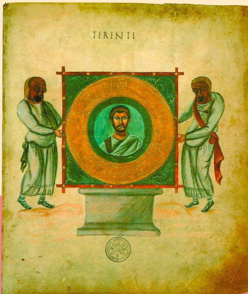
Миниатюра из рукописи с текстом комедий Теренция, Около 825 г. Ватиканская библиотека, Рим.

И все же главным достижением каролингского Возрождения, вне всякого сомнения, остается каролингский минускул, почти двести лет бывший практически единст-