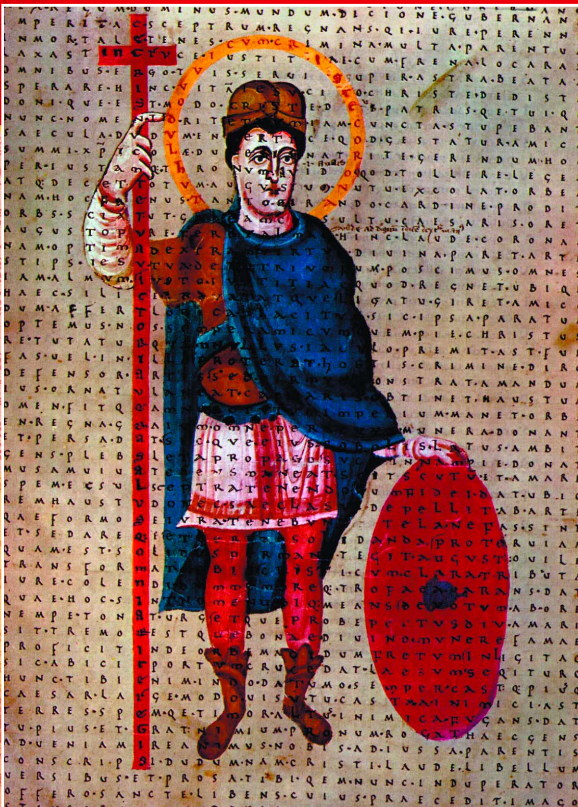
Людовик I Благочестивый, сын и приемник Карла Великого. Миниатюра, созданная около 840 г. в Фульдском монастыре для поэмы Рабана Мавра «Liber de laudibus Sanctae Crucis» – «О похвале Святому Кресту». Фоном служит текст, написанный без пробелов. Австрийская национальная библиотека. Вена.

Теодульф и другие. Но самая заметная фигура того времени, безусловно, Алкуин из Йорка, заслуги которого были столь велики, что принесли ему титул: «наставник Галлии». Алкуин был одним из идеологов