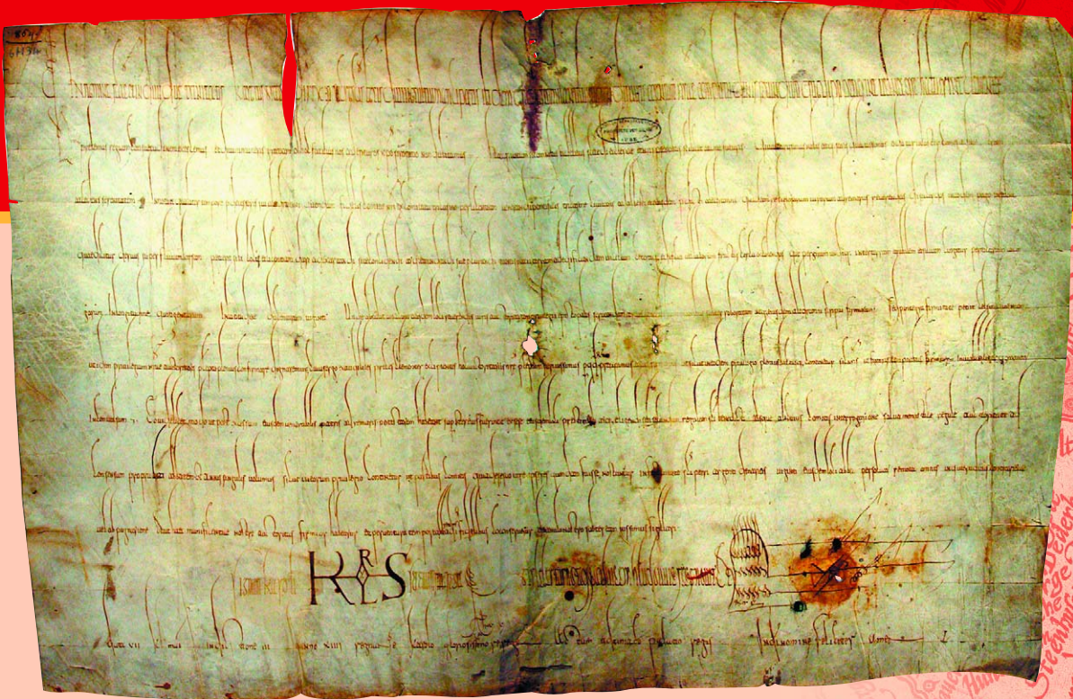
Распоряжение Людовика I Благочестивого, датированное 25 апреля 854 г. о выделении земли и кромки леса в графстве де Труа под строительство церкви основанного в 837 г. бенедиктинского монастыря Сен-Пьер. Написано каролингским минускулом.

Познакомившись с рукописями каролингского периода, гуманисты посчитали их памятниками античности, и попытались воспроизвести начертания чудесных каролингских букв в своих книгах. В результате этих попыток и сформировалась антиква – «древнее» или гуманистическое письмо, легшее в основу всех европейских шрифтов последующих веков.