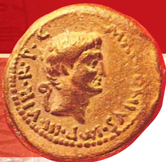
Золотая монета с изображением Антония. Рим, Капитолийские музеи.

Смерть Клеопатры. ➡ Худ. Валентин Кэмерон Принсеп. 1870 г. Аукцион «Сотбис».