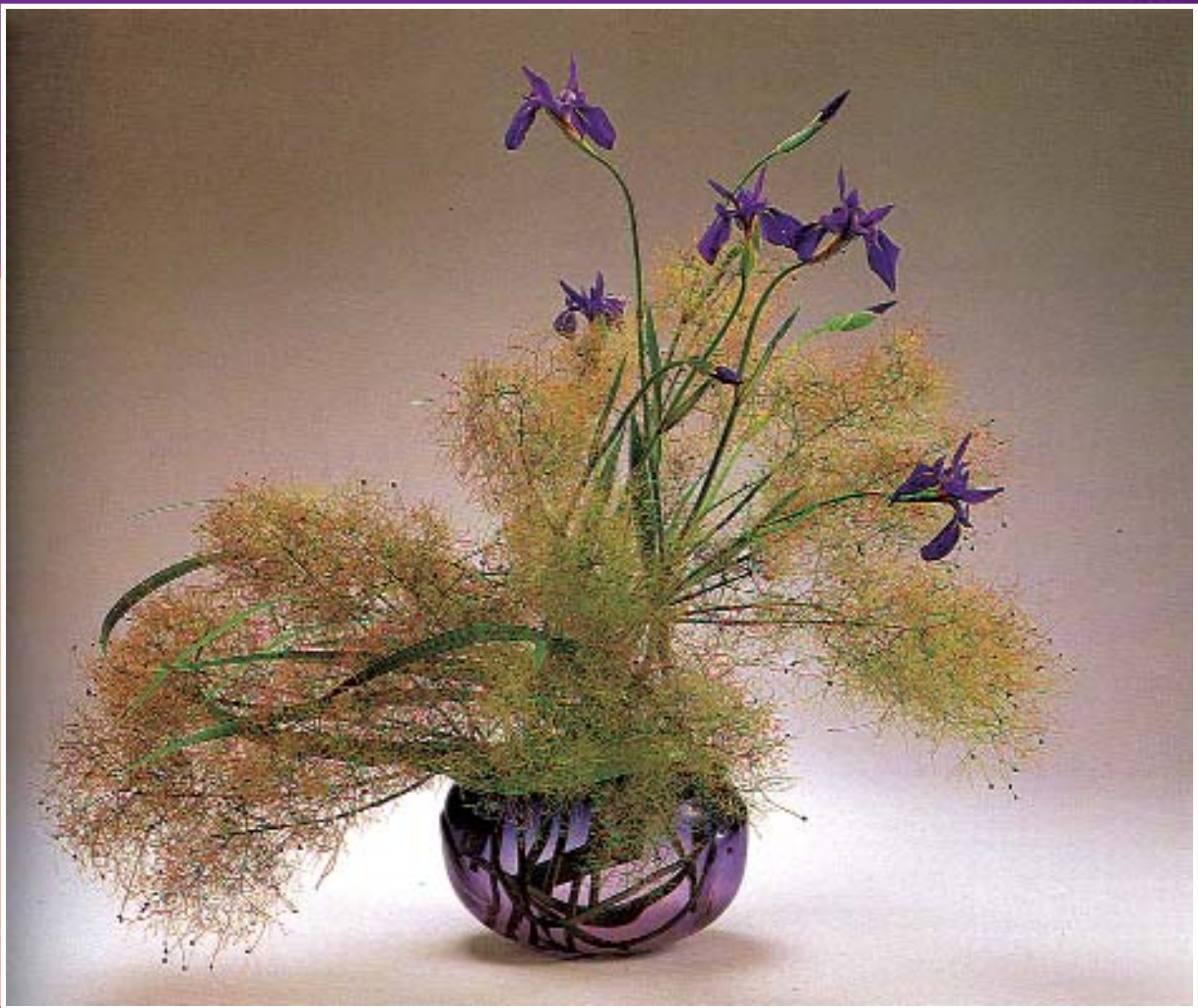
← Зигзагообразный мост и ирисы, храм Хэйан. Фотография Мидзуно Кацухико из альбома «Дух Киото».