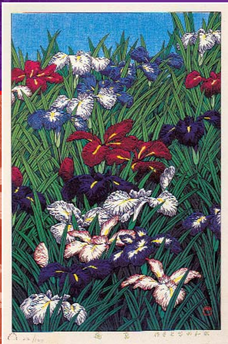
Ирисы аямэ. Худ. Кавасе Хасуи. 1929 г. Бумага, цветная ксилография.

Словом аямэ в Японии называются «женские» сорта ирисов.