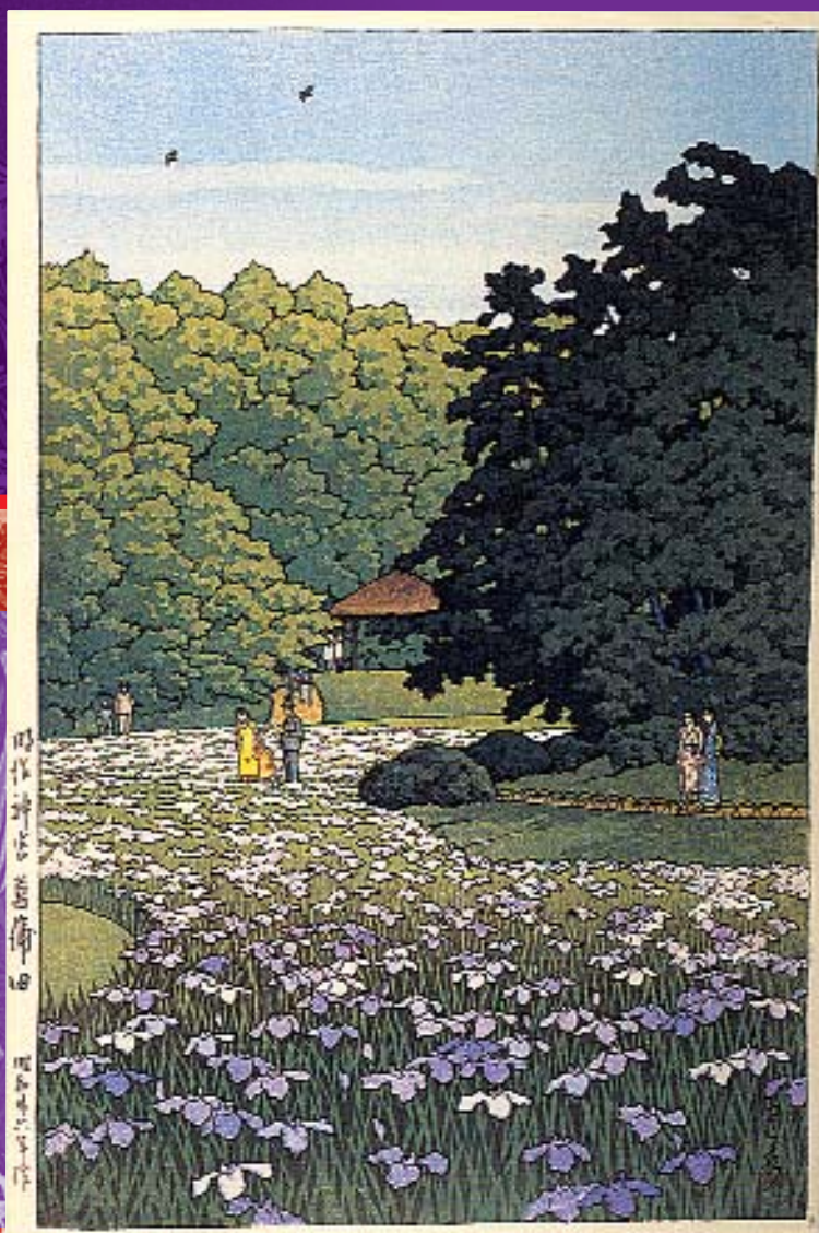
Сад ирисов (сёбу) и храм Мэйдзи. Худ. Кавасе Хасуи. 1951 г. Бумага, цветная ксилография.

Словом сёбу в Японии называются «мужские» сорта ирисов.