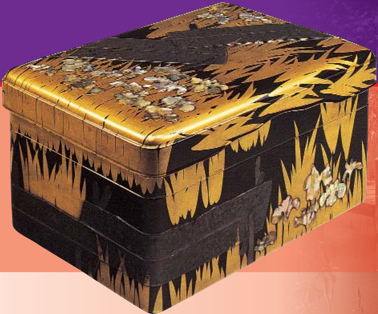
Шкатулка для письменных принадлежностей с рисунком «Восемь мостов». Дизайн Огаты Корина. Период Эдо, XVIII в. Лаковое изделие, украшенное золотом и перламутром в технике маки-э. Высота 14, 2 см. Национальный музей, Токио.

все окрашено в лиловый цвет. «Как тюльпаны в Голландии, так здесь ирисы красуются на широких полях... спустя несколько дней расцветают глицинии... В невероятном изобилии выются они вдоль дачных построек, на дворцах и лачугах, на чайных домиках и искусственных беседках; при этом еще бедняки часто насаживают ирис на верхушку своего дома, так что он в июле бывает покрыт лиловыми цветами ириса», – писал немецкий ученый Эрнест фон Гессе-Вартер.