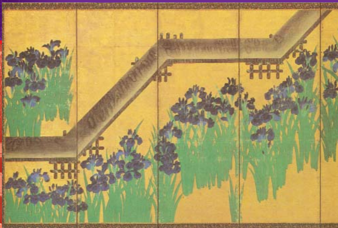
Восемь мостов. Ширма из шести створок. Худ. Огата Корин. Период Эдо, XVIII в. Бумага, позолота, тушь, краски. 179, 1 x 371, 5 см. Музей Метрополитен, Нью-Йорк.

ирис запрет не распространился – он был цветком духовным.